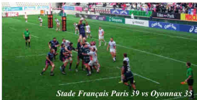
Stade Français Paris 39 vs Oyonnax 35