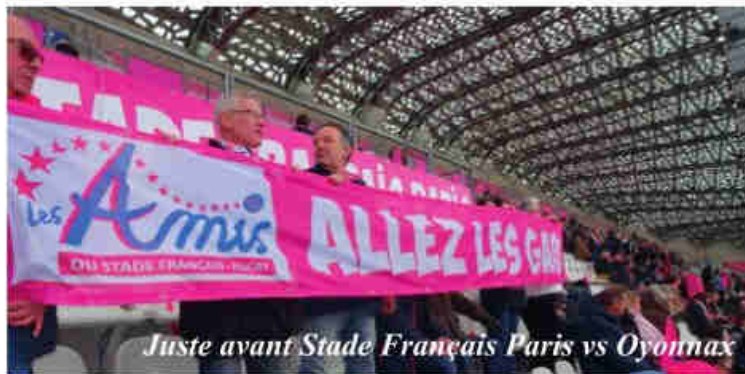
Juste avant Stade Français Paris vs Oyonnax