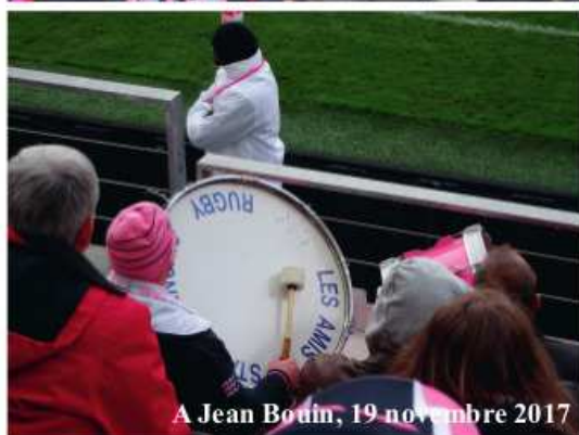
A Jean Bouin, 19 novembre 2017