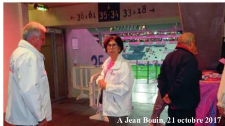
A Jean Bouin, 21 octobre 2017

© Bord de Touche N° 245 - Bulletin gratuit - Tirage 1 000 exemplaires, avec compensation de CO2 - Mise sous presse le 14/3/2018