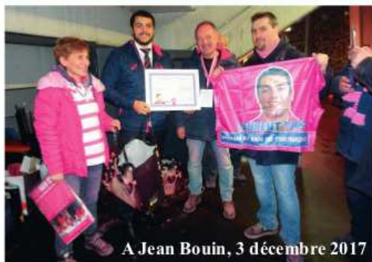
A Jean Bouin, 3 décembre 2017