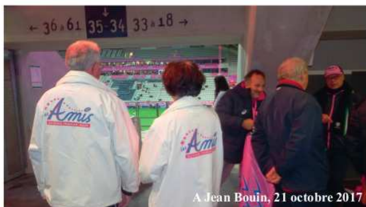
A Jean Bouin, 21 octobre 2017