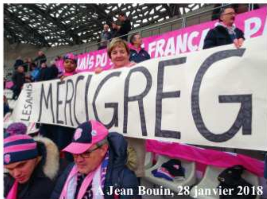
A Jean Bouin, 28 janvier 2018