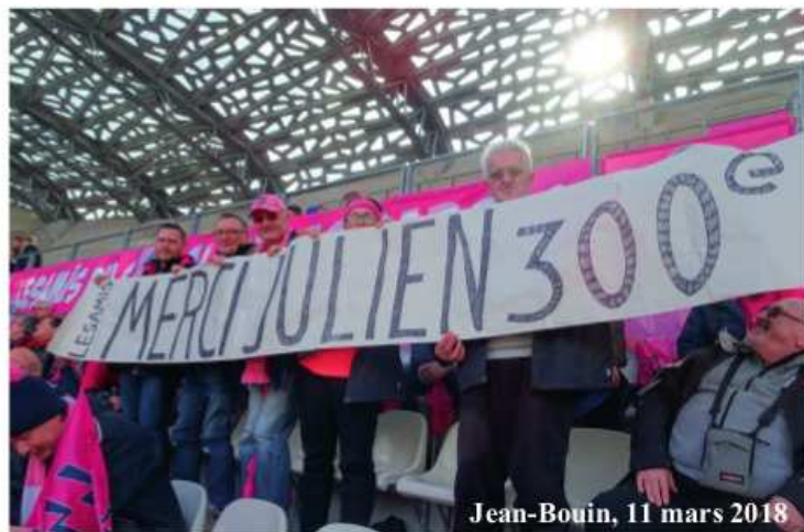
Jean-Bouin, 11 mars 2018