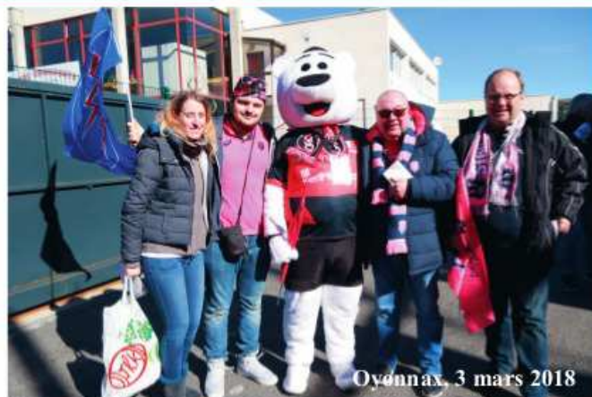
Oyonnax, 3 mars 2018