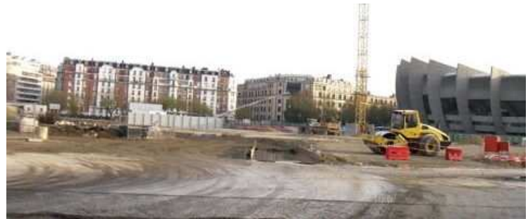
Côté « Vestiaire des joueurs » rue Nungesser et Coli

Ce 2 décembre, un nouveau petit détour par notre cher stade Jean Bouin, pour constater l'avancement des travaux.