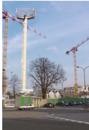
Côté entrée « Place de l'Europe »

Nombreuses grues à l'horizon et disparition de tous les gravats.