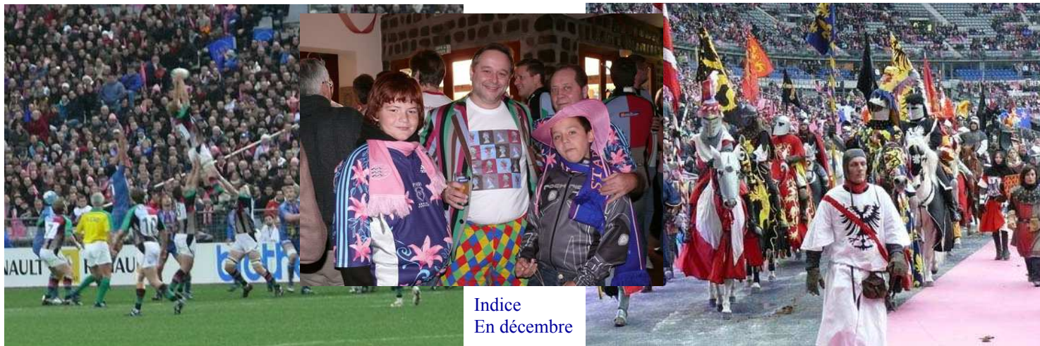
Indice En décembre