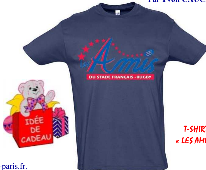
T-SHIRT « LES AMIS »

Demandez-le à un membre de notre bureau ou sur notre site amistade-paris.fr .