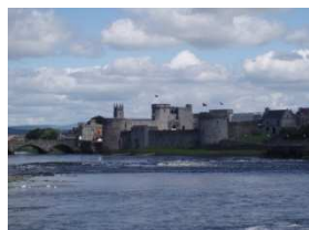
King John's Castle Limerick

Il est édifié sur King's Island, une île située sur le fleuve Shannon dans le quartier médiéval de la ville de Limerick.