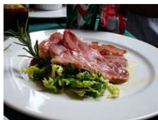
Roast Limerick Ham - Colin Campbell The Sisters Restaurant, Jordanhill, Glasgow.

Il s'agit d'un jambon fumé aux baies de genévrier, cuisiné dans du cidre, du sucre et de la moutarde. Les habitants de Limerick ont pour habitude de le déguster en tranches, avec des pommes de terre, ou du chou.