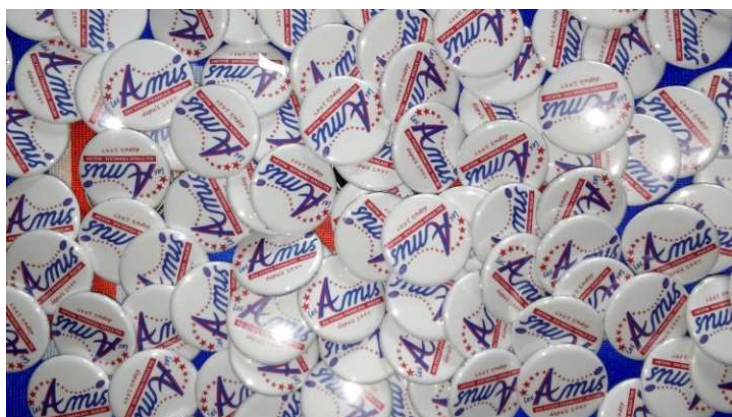
NOUVEAU BADGE 32 MM DES AMIS

Demandez-le à un membre de notre bureau ou sur notre site amistade-paris.fr .