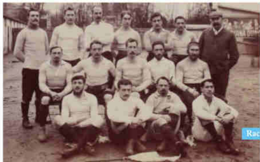
Racing Club de France - 4 janvier 1903

Le Racing Club, fondé en 1882, est à l'origine une association vouée à l'athlétisme. Devenu Racing club de France en 1885, la section rugby est créée en 1890. Le club remporte le premier championnat de France en un match unique, le 20 mars 1892, en battant le Stade français Paris rugby 4-3. L'année suivante, les Stadistes prennent leur revanche (7-3).