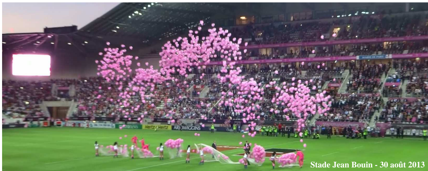
Stade Jean Bouin - 30 août 2013