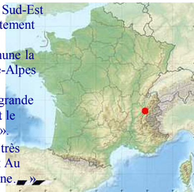
« France relief location map »

Elle a organisé les Jeux Olympiques d'hiver de 1968 pendant lesquels Jean-Claude Killy remporta les trois épreuves de ski alpin (descente, slalom spécial, slalom géant).