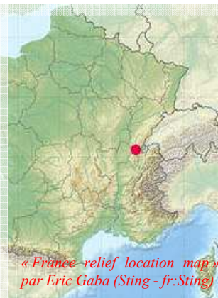
« France-relief location map » par Eric Gaba (Sting - fr:Sting)

Cette production s'est industrialisée à la fin du XIX ème siècle, avant de subir une révolution : l'arrivée du plastique. Oyonnax est aujourd'hui au centre de la Plastics Vallée.